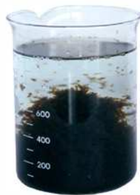
高分子凝集剤 添加後